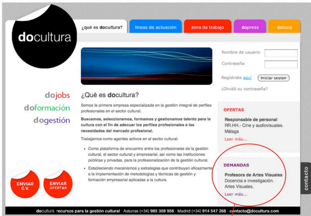
Anuncio tipo "portada web"